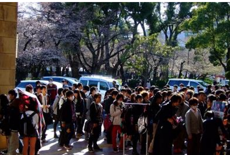
見ごろを迎えた桜の木の下 開場前から長い列をつくる熱心なファン

※終演後は、この日に合わせて始めた桜色のライトアップが興奮冷めやらぬファンを見送りました。