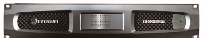
導入予定のサラウンド用アンプ DCi 4 | 300N

1階吹き抜け部分は12台の仮設スピーカーによる5.1chのサラウンドシステムに対応しています(有料)。 デジタル映写機と併せて、映画の試写会・上映会やコンサート等のライブビューイングが、シネマコンプレックス等と同等の質の高い環境で鑑賞できます。さらに、サラウンドシステムを活用したミュージカルや2.5次元舞台などの上演にもお勧めです。