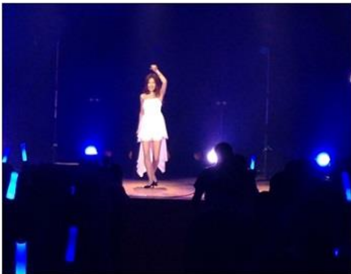
Larval Stage Planning

※4組も楽しめるとあって会場は大盛り上がり！全員が代表曲をたっぷりと披露し、アーティストそれぞれが持つ個性を最大限に発揮した熱いステージでした。